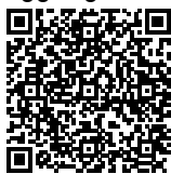
EXCEL NAISHAR ELFRANSA Ketua TUK